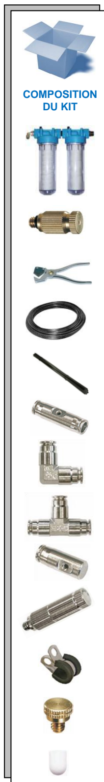
COMPOSITION DU KIT

KIT POLYAMIDE : la solution idéale pour la réalisation des installations de brumisation soit pour le rafraîchissement, soit pour créer des effets scéniques. Kit "à monter soi même", pour réaliser une installation dans un jardin par exemple. Ce système de gaine est la solution la plus économique et la plus simple pour bénéficier d'un effet rafraîchissant sans devoir renoncer aux caractéristiques de la brumisation professionnelle haute pression.